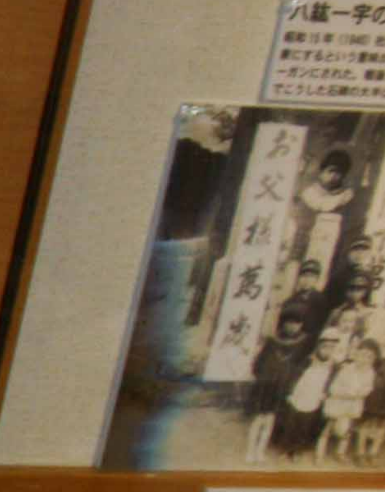
神社前で子どもたちの 神社前で子どもたちの。神社前で子どもたちの。