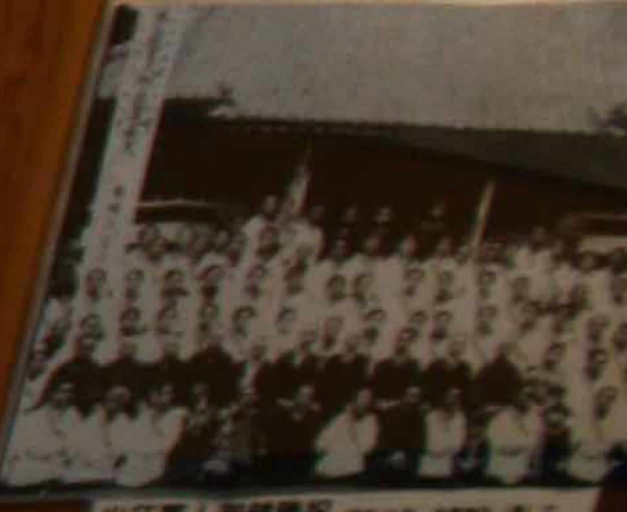
出征軍人送別会 出征軍人送別会。出征軍人送別会。