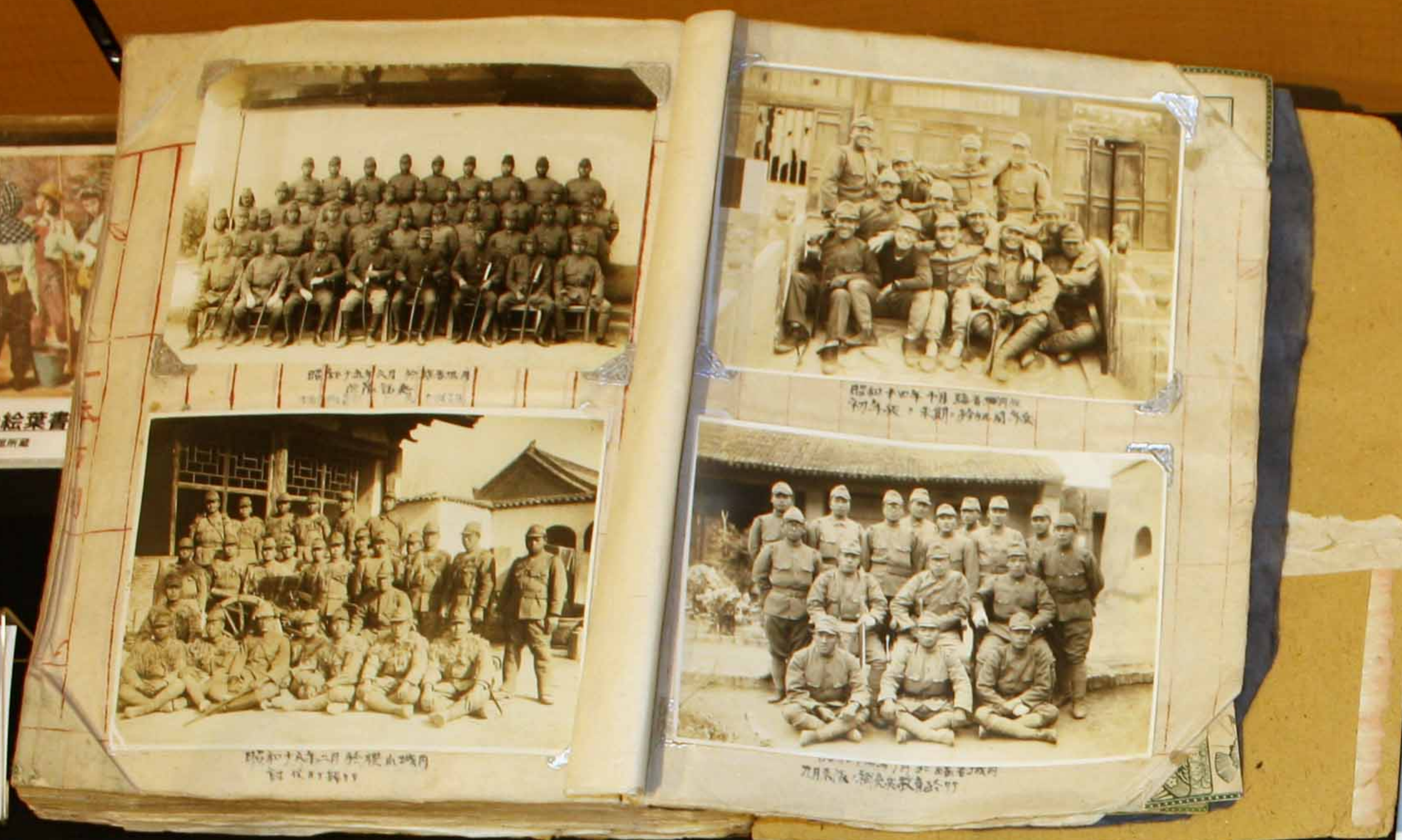
築城出身兵士のアルバム

Handwritten Japanese text, likely a diary or report, with vertical columns of characters.