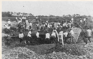
京都郡青年団による基地建設風景

昭和19年(1944)以降はアメリカ軍による基地周辺の空襲に備え、行橋市稲童に中型戦闘機を格納する掩体(壕)が築かれ、築上町広末や赤幡の丘陵に弾薬倉庫壕や通信施設壕が造られた。また、100機以上の九三式陸上中間練習機(通称/赤トンボ)等の小型戦闘機は金富神社(築上町湊)の社叢ほか、町内各地に分散格納された。