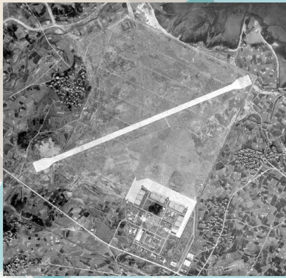
終戦直後の築城飛行場 (昭和22年/1947)