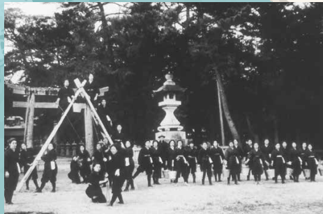
網敷天満宮前で防空訓練 (昭和17年/1942)