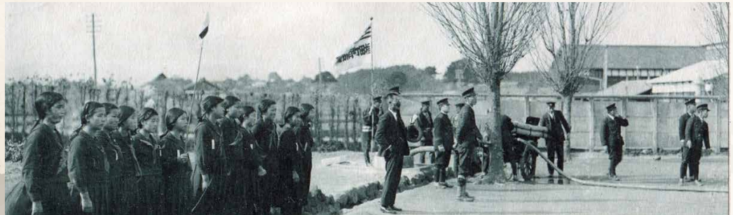
椎田高等実業女学校 (現築上西高校) 生徒による防空防火避難演習 (昭和14年/1939)