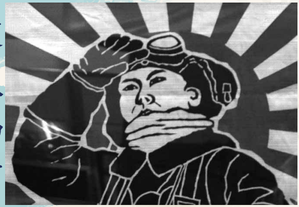
貴様と俺とは同期の桜 同じ航空隊の庭に咲く