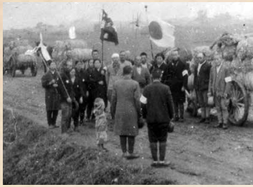
出征兵士の見送り(築上町内) (中央の出征兵士に少年が敬礼する)

昭和恐慌を契機に国内経済の行き詰りを打破するため、中国大陸に資源と市場拡大を求めた日本は、昭和6年(1931)、関東軍が自ら仕組んだ南満洲鉄道爆破事件を契機に、軍事行動を拡大し、半年ほどで中国東北部を占領し、満州国を建国した。(満州事変)