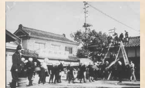
防火訓練(延塚記念館前/昭和17年) (指揮者以外はすべて女性)

昭和20年(1945)3月から8月まで7回空襲に遭った。特に8月7日の空襲では、重箱池周辺で作業中の民間人多数と37人の兵士が死亡した。上城井国民学校(築上町本庄)では機銃掃射で教師・児童4人が死亡し、数人が負傷した。翌8日、局地戦闘機「紫電改」がアメリカ軍小型戦闘機4機と戦闘の末、小原に墜落し、乗員が死亡した。