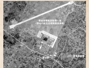
築城飛行場とゼロ戦の着艦訓練場