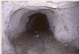
弾薬倉庫壕(築上町広末)