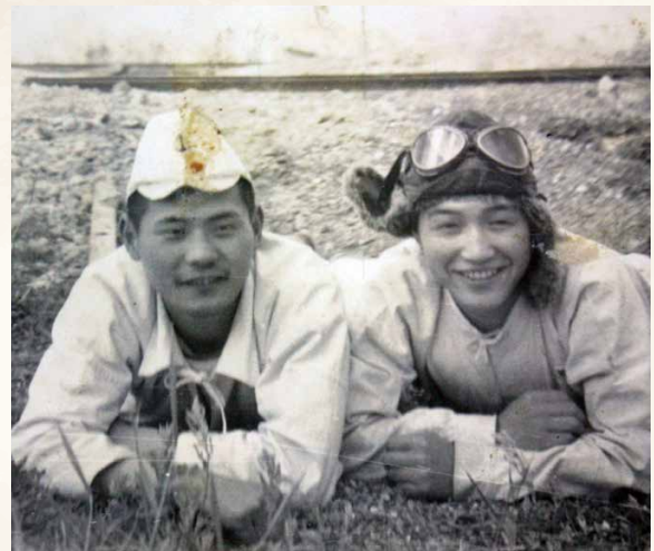
築上町上別府で下宿していた兵士