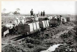
正八幡神社移転先の造成工事 『八田庄鎮座郷社正八幡神社移転改築記念写真帳』(昭和18年)