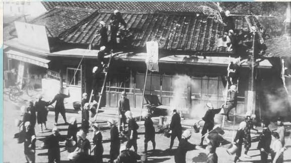
空襲に備えた防火訓練 (椎田駅前/昭和17年/1942)