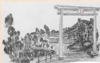
金富神社社叢内隠匿の九三式陸上中間練習機(航空自衛隊築城基地所蔵)