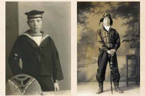
椎田で下宿した兵士が遺した写真(裏には名前やメッセージがある)