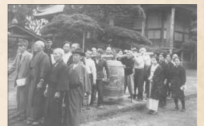
金属供出(築上町水原/昭和17年)