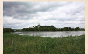
現在の重箱池(横井塚池/西八田)