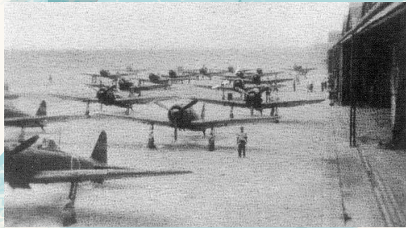
格納庫前に並ぶ零式艦上戦闘機