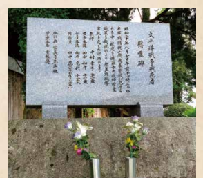
太平洋戦争戦死者慰霊碑 (上城井小)